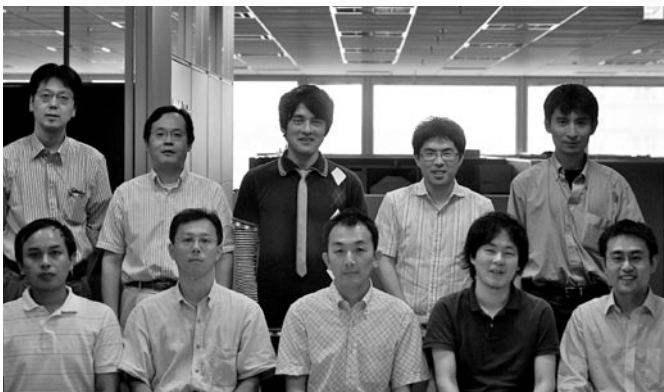
東京基礎研究所の数理学系の研究メンバー

電力コスト削減のほかにも、マーケティングの最適化、税金徴収の最適化、渋滞を考慮した運転経路の最適化など、マルコフ決定過程は広範囲の分野で応用できる技術です。また、その効果もコスト削減、サービスの向上、省エネルギー、省資源など多岐にわたるものが期待されます。